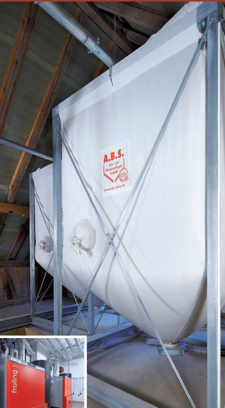
FLEXILO® MAXI für zwei Pelletkessel mit je 48 kW Leistung auf einem Dachboden