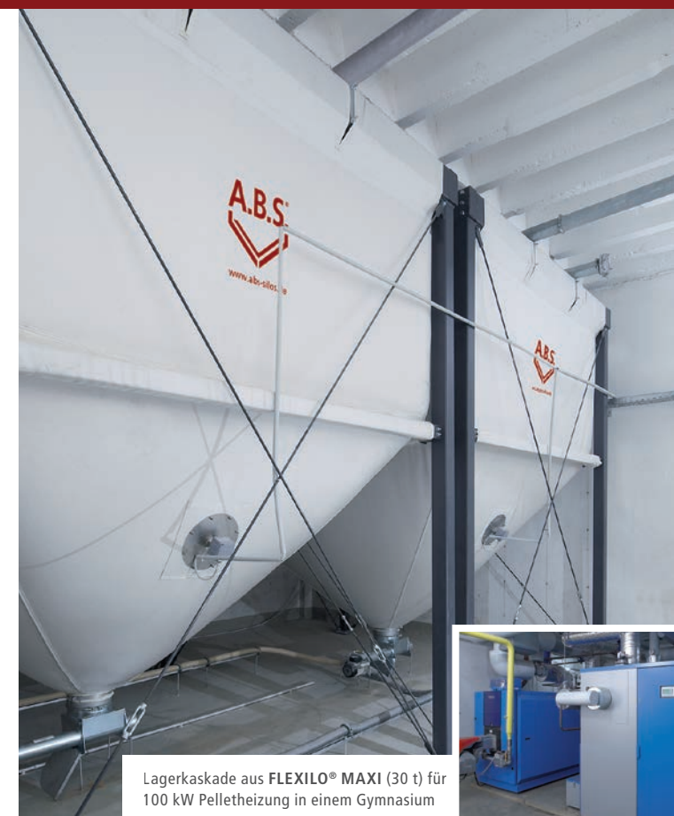
Lagerkaskade aus FLEXILO® MAXI (30 t) für 100 kW Pelletheizung in einem Gymnasium

Zu dem besonderen Service der A.B.S. gehört eine umfassende Betreuung während der gesamten Anlagenplanung.