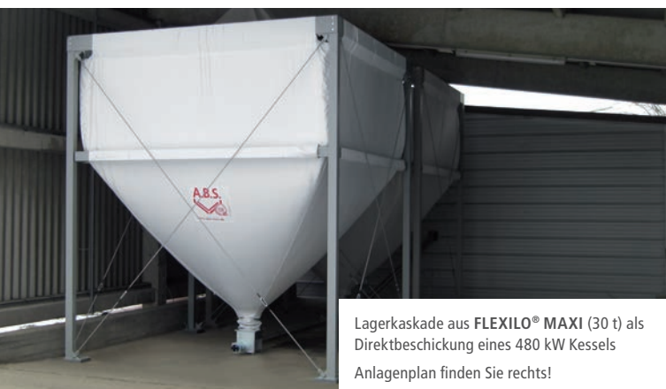
Lagerkaskade aus FLEXILO® MAXI (30 t) als Direktbeschickung eines 480 kW Kessels Anlagenplan finden Sie rechts!